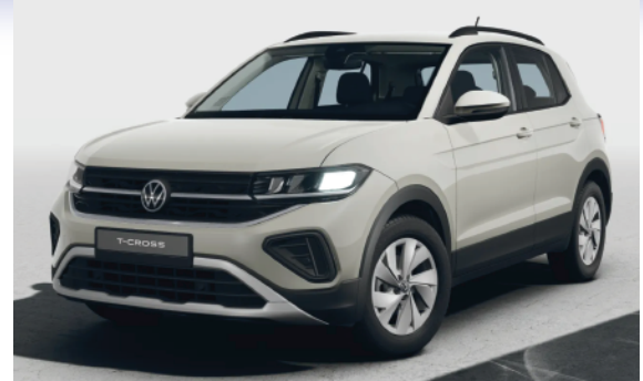
Bild computergeneriert, Darstellung nicht verbindlich

Lackierung: Ascotgrau Innen: Grau-Melange