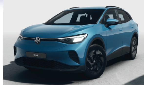
Bild computergeneriert, Darstellung nicht verbindlich

Lackierung: Costa Azul Metallic Schwarz Innen: Schwarz