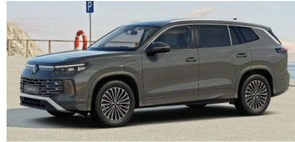
Bild computergeneriert, Darstellung nicht verbindlich

3D-LED-Rückleuchten, LED-Plus-Scheinwerfer, 4 Leichtmetallräder "Napoli" 7,5 J x 18, Rückfahrkamera "Rear View", Verkehrszeichen-erkennung, Sport-Ausstattung, u. v. m.