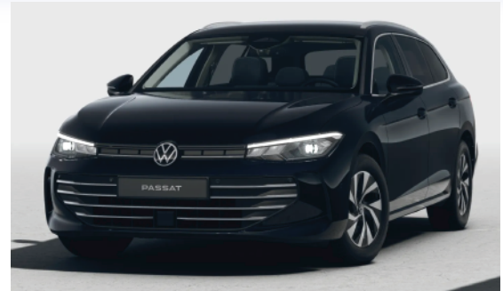
Bild computergeneriert, Darstellung nicht verbindlich

Anhängevorrichtung inkl. Anhängerrangierassistent "Trailer Assist", Business Premium"-Paket, Interieurpaket, u. v. m.