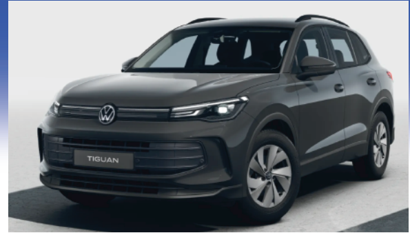
Bild computergeneriert, Darstellung nicht verbindlich

Lackierung: Uranograu Innen: Soul-Schwarz