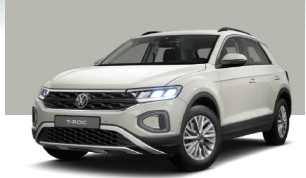
Bild computergeneriert, Darstellung nicht verbindlich

Lackierung: Ascotgrau Innen: Titanschwarz-Ceramique